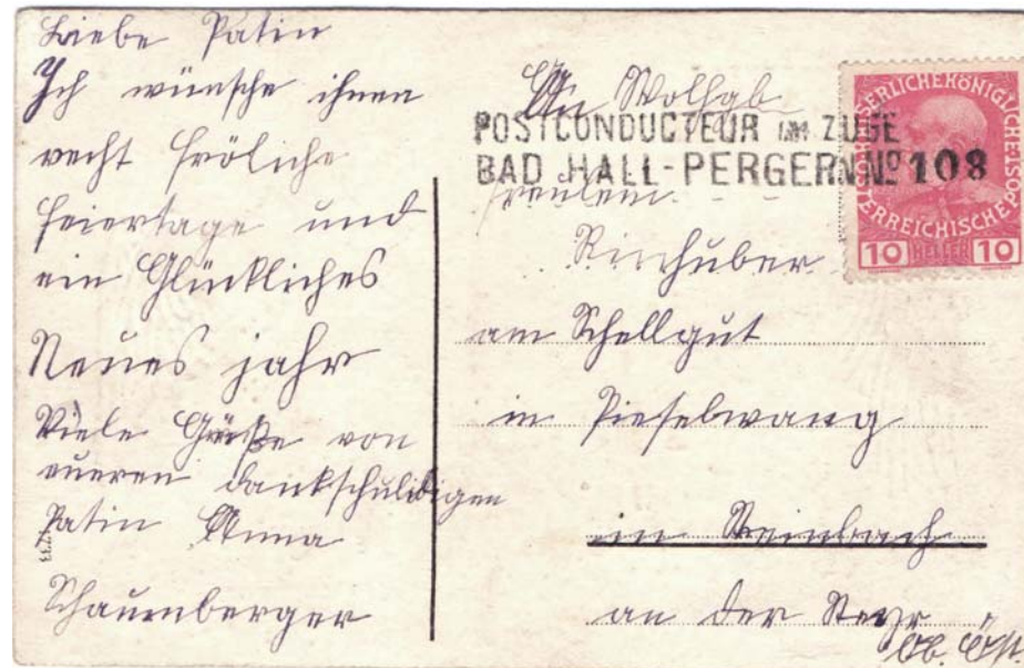
Postconducteurstempel Bad Hall -Pergern Nr. 108 (HP108) auf Ansichtskarte. Gebühr 10 Heller. Diese Markenserie wurde 1908 ausgegeben. Der Beleg ist somit zwischen 1908 und 1913 gelaufen. Das genaue Datum ist nicht mehr eruierbar, da im Stempel nicht ersichtlich. Leider wurde in dieser Zeit auch kein Ankunftsstempel mehr abgeschlagen.

GARSTEN 79 - 09 - 23 - 10 c O B S 81 01532 - 1 00